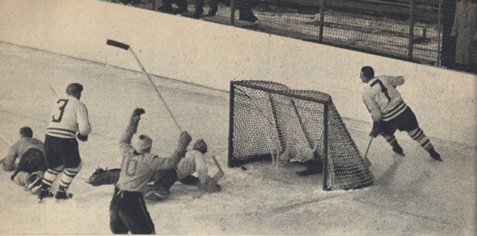
SVERIGE—POLEN 12—2. Det var inte någon av sina bästa matcher Tre Kronor presterade mot polackerna, men målen rullade in med jämna mellanrum. Här har Tumba gjort det nionde och i skottögonblicket gått på öronen (t. v.). Lill-Stöveln signalerar fullträffen.